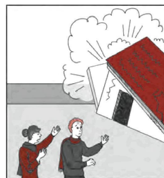
Рис. Елены ГНЕДКОВОЙ