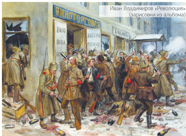
Иван Владимиров «Революция» (зарисовки из альбома)

Большевики боролись не с эмиссией денег, а с деньгами