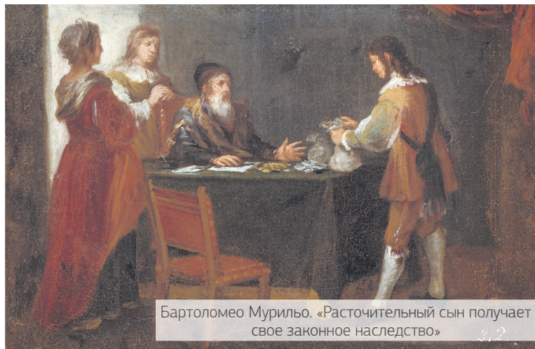
Бартоломео Мурильо. «Расточительный сын получает свое законное наследство»

Вклады же, по которым завещание (завещательное распоряжение) было оформлено вкладчиком до 1 марта 2002 года, не входят в состав наследственного имуще-