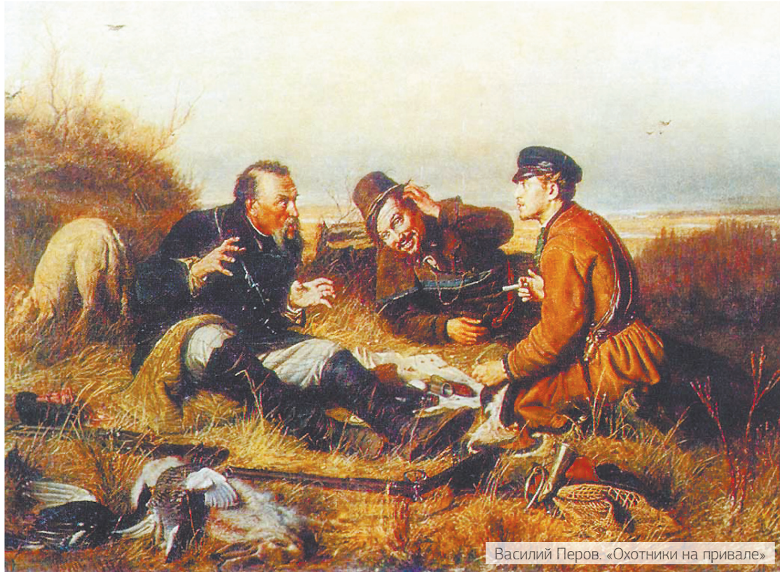
Василий Перов. «Охотники на привале»

владелец планирует комплексную реконструкцию и перedelку, то может в итоге получить «квартиру своей мечты» за гораздо меньшие деньги, нежели бы он все это делал в более дорогой новостройке.